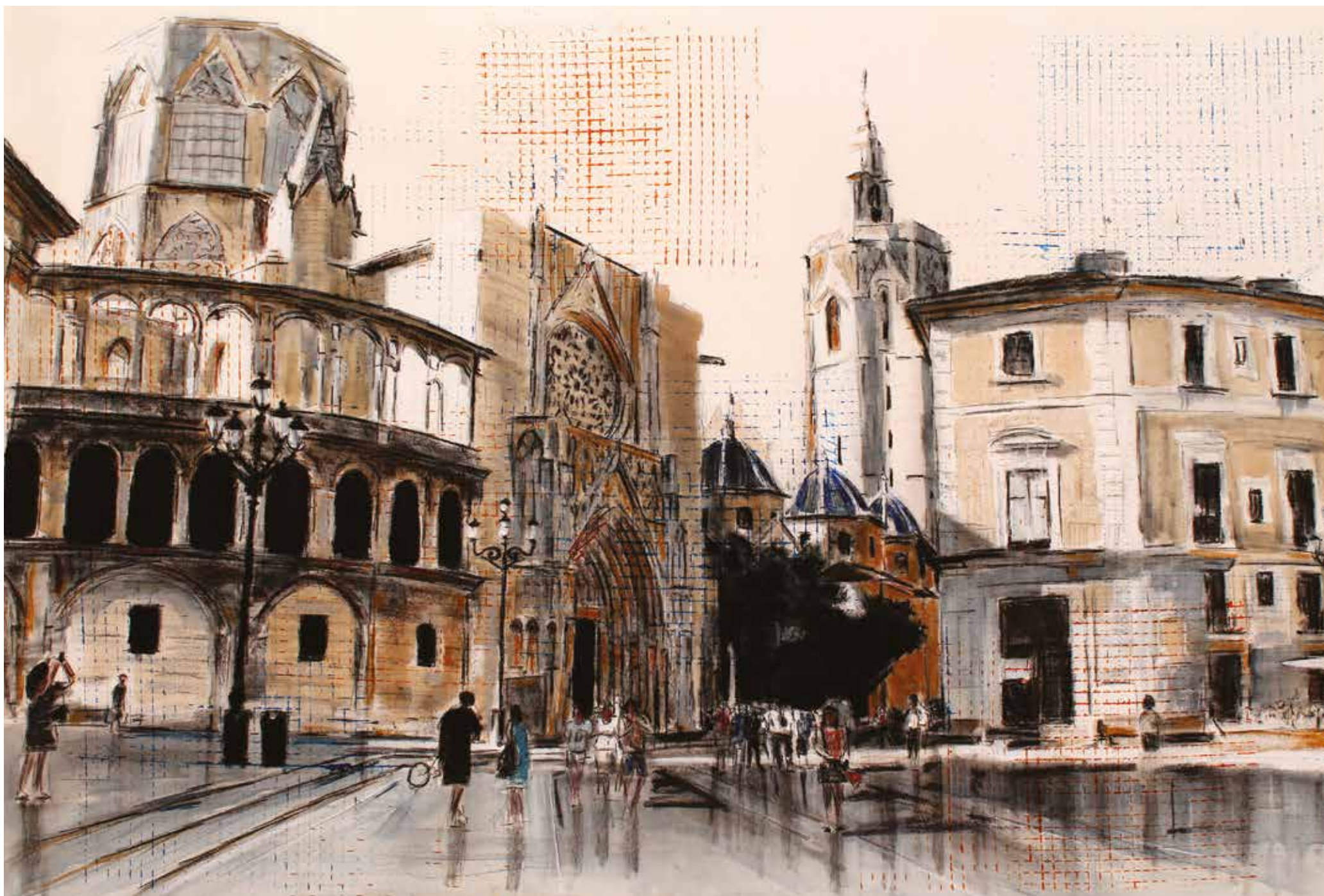
Plaça de la Verge Técnica Mixta. 100 x 150 cm