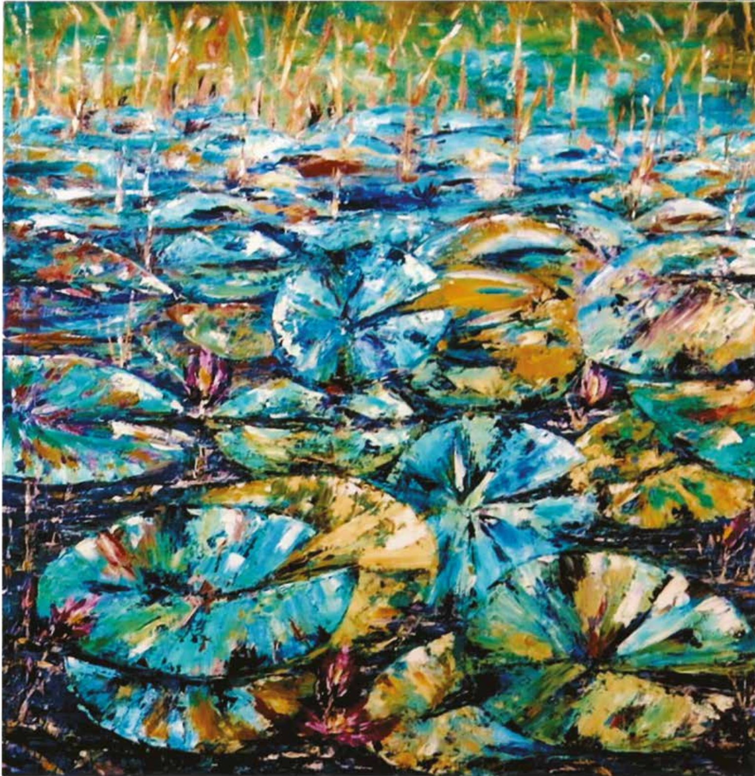
Por el estanque... Óleo. 100 x 100 cm