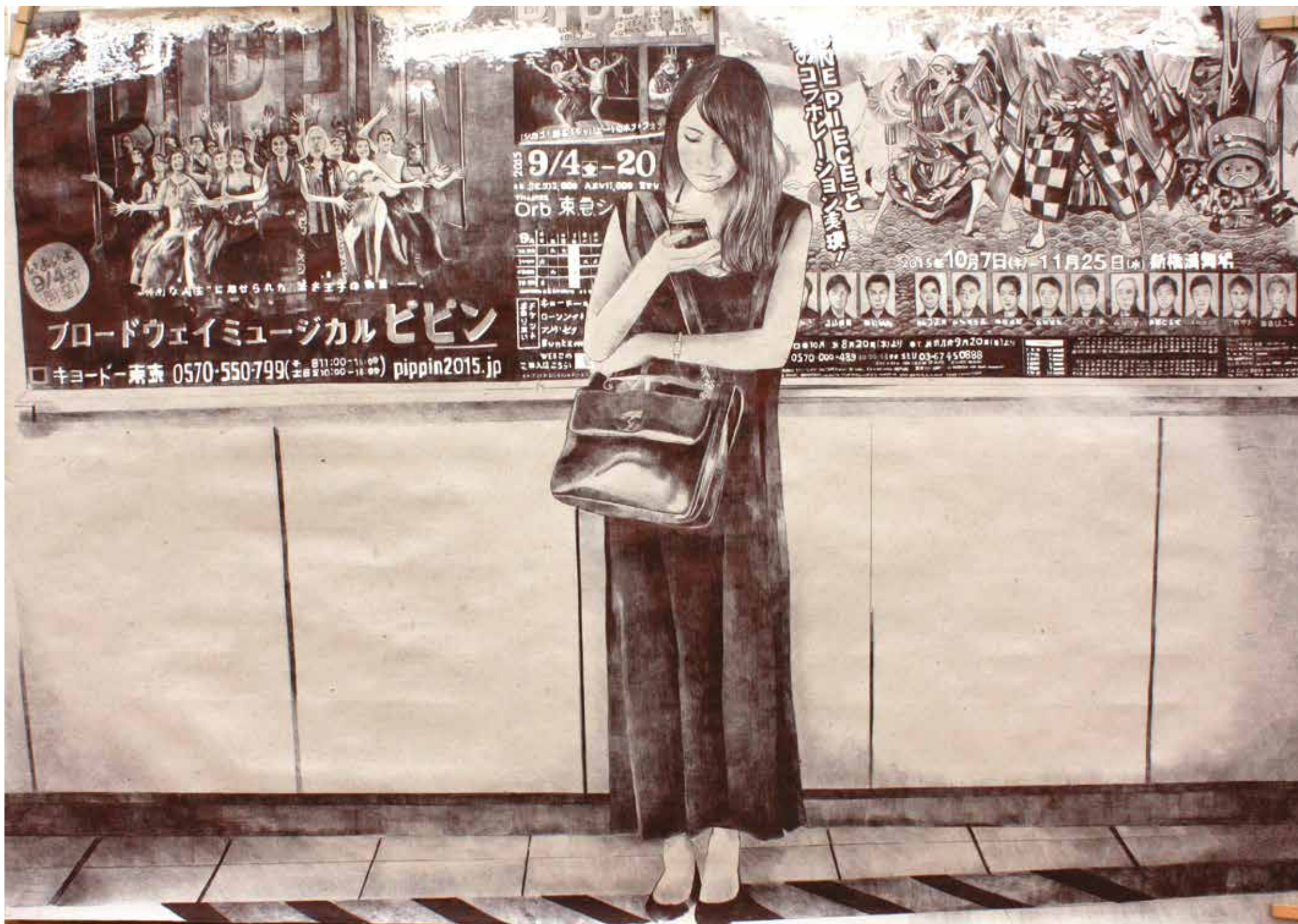
Alone Together XVI Bolígrafo sobre papel y posca blanca. 70 x 100 cm