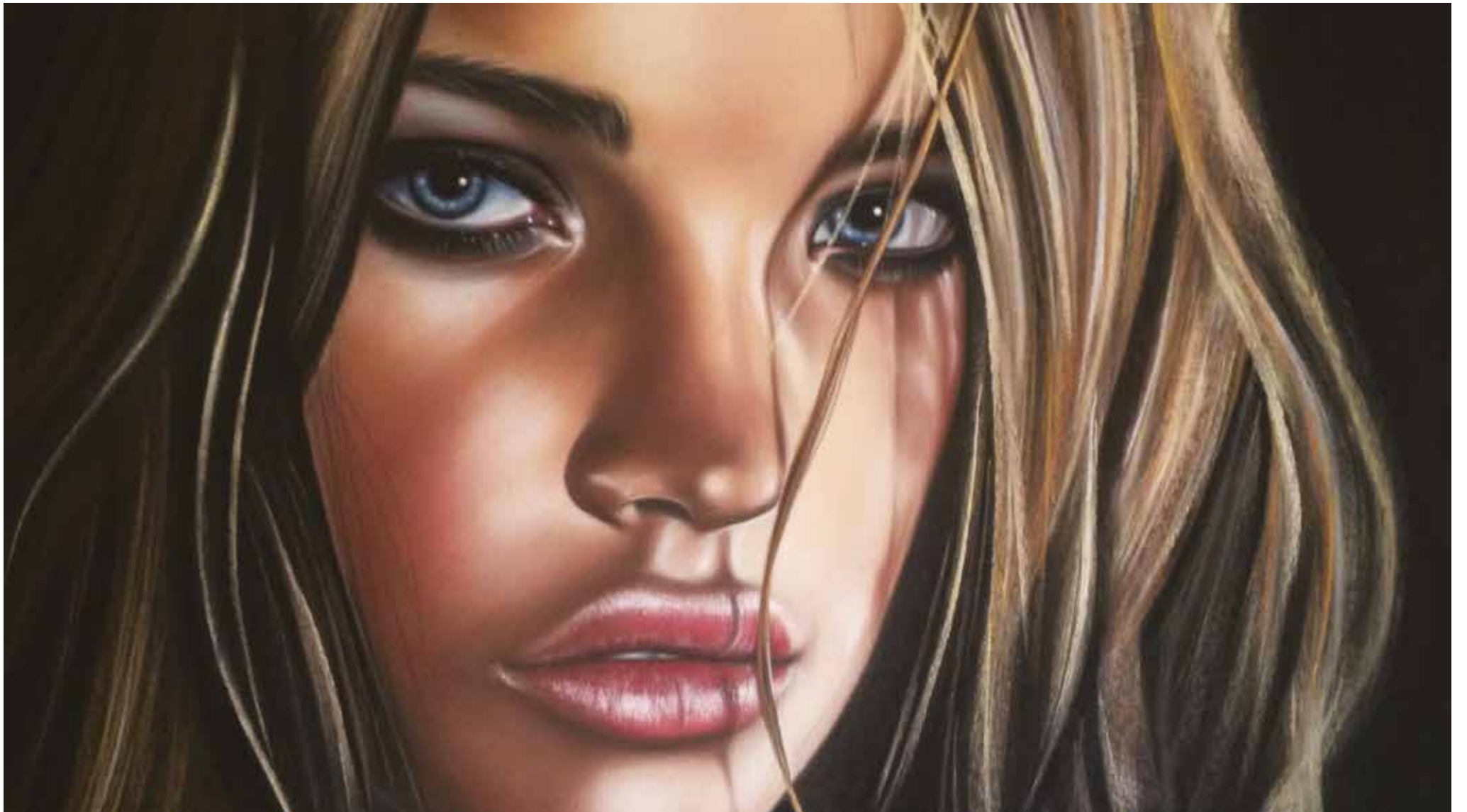
Natalia Pastel. 60 x 80 cm