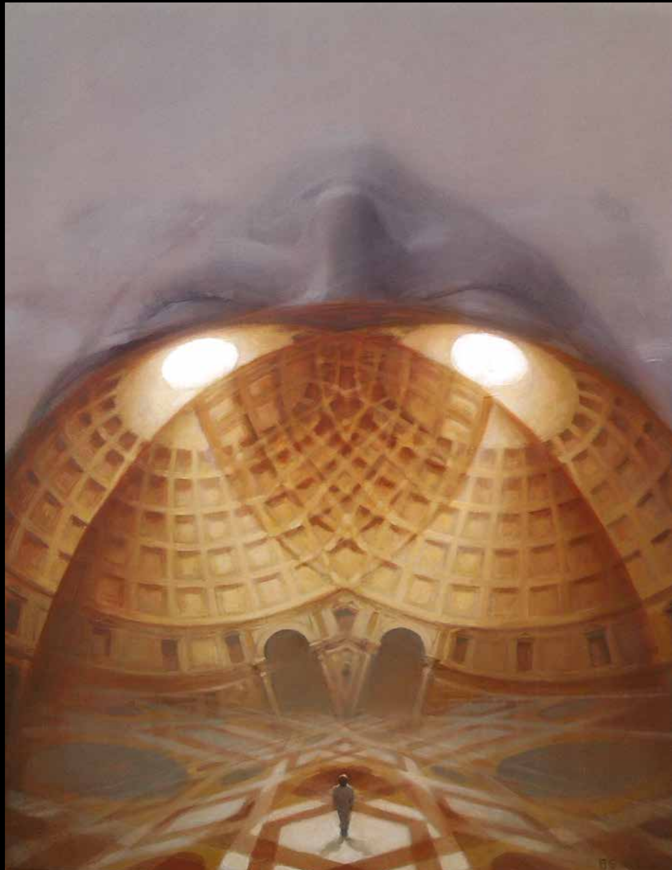
Lux Acrílico sobre tabla. 80 x 120 cm