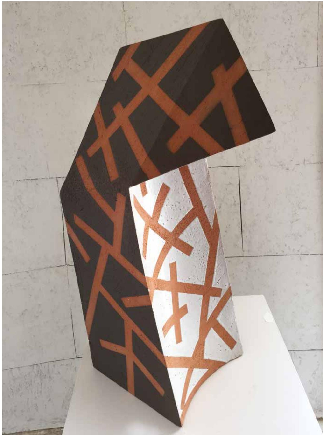
Refugio Cerámica con engobe. 66 x 40 x 22 cm