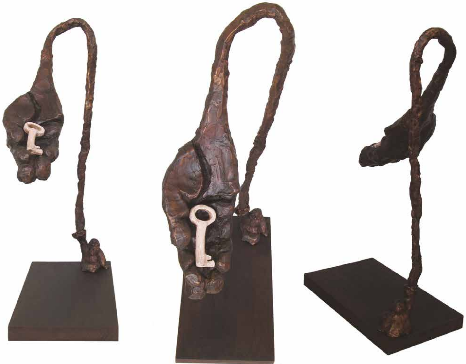
Moisés Madera y bronce. 18 x 32 x 58 cm