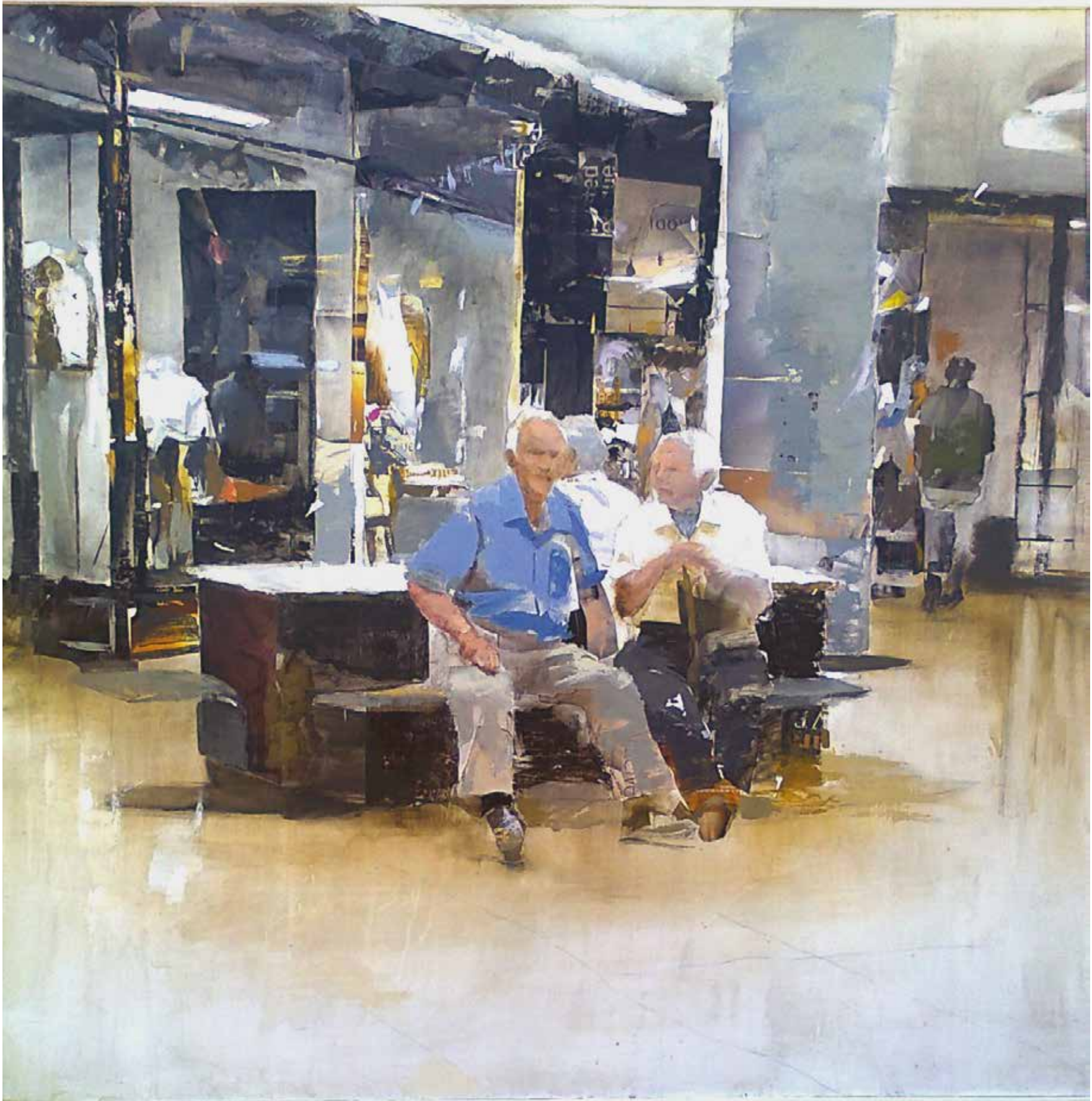
Edad dorada (Serie "Carne Comercial") Collage y acrílico sobre tabla. 100 x 100 cm