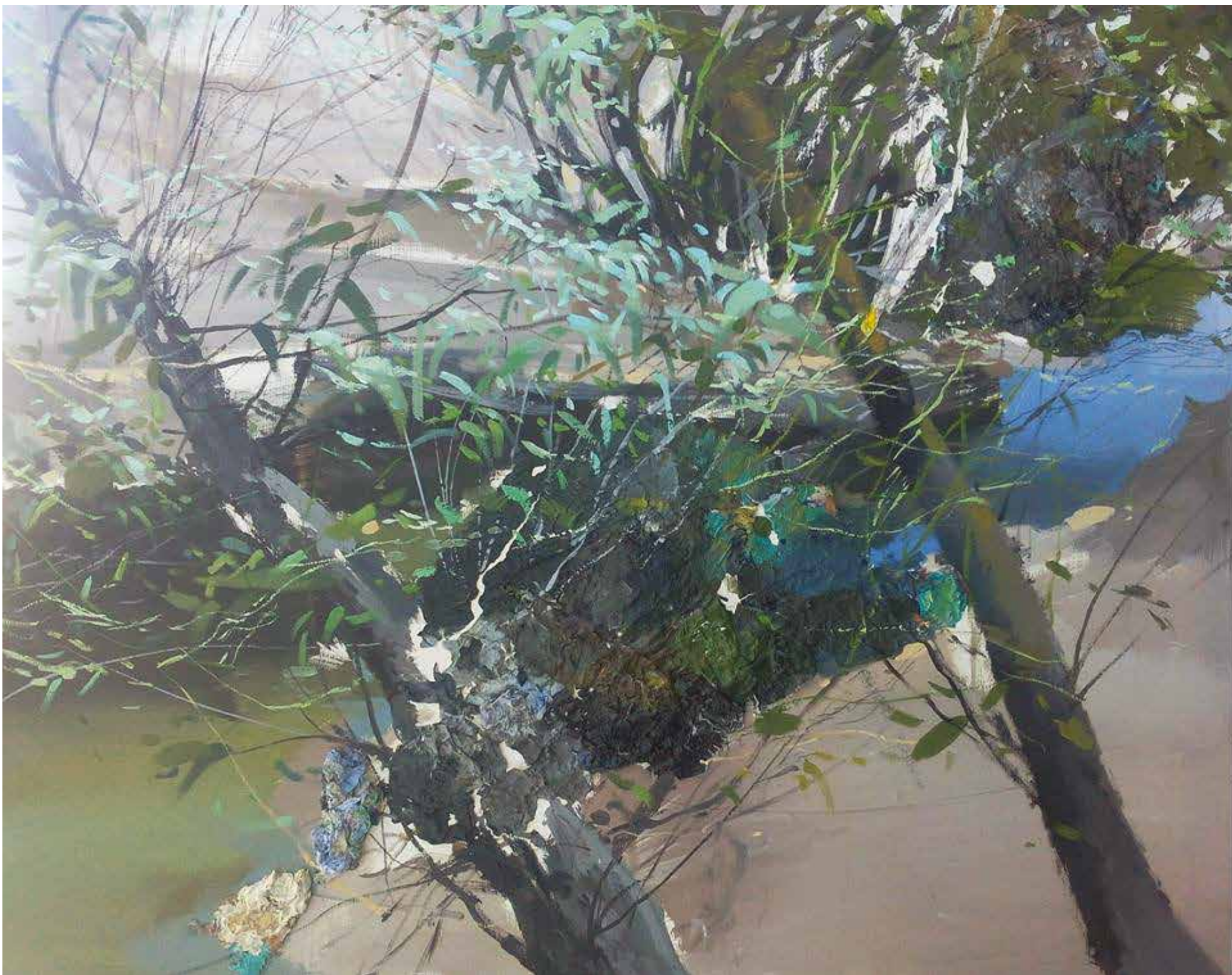
En el río Técnica Mixta. 81 x 100 cm