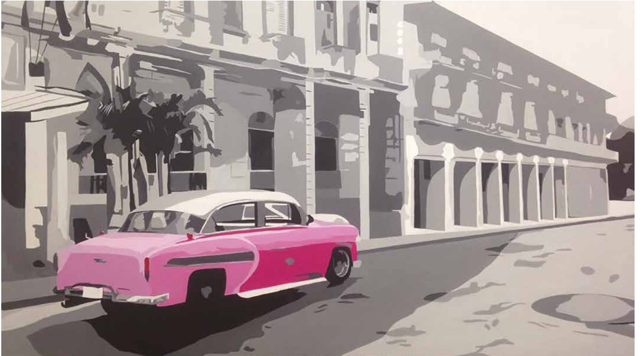
Paisaje urbano XV Acrílico sobre tela. 90 x 150 cm