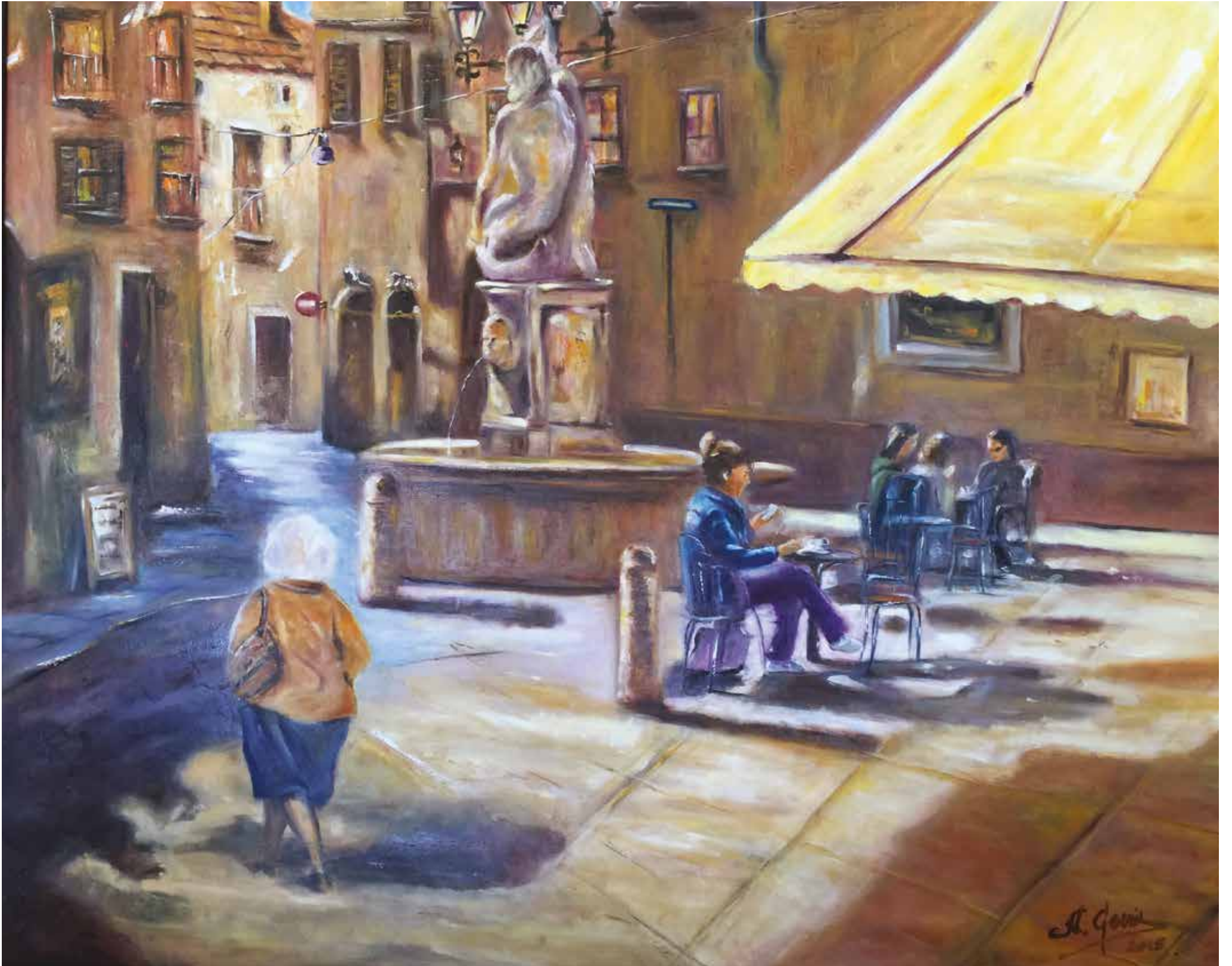
Por mucho que pasen los años. Óleo. 100 x 120 cm