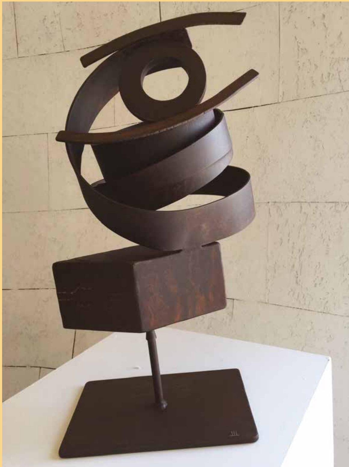
Ojo retorcido Hierro. 30 x 30 x 57 cm