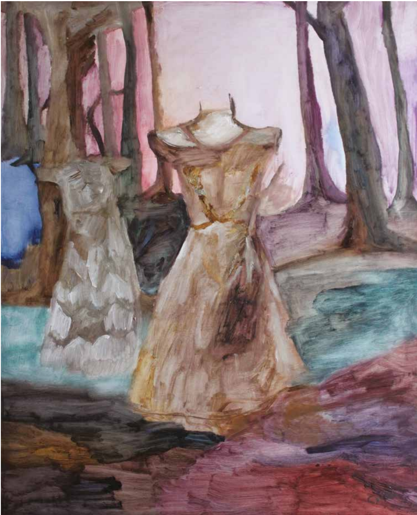
Maniqués en el bosque 2 Óleo sobre madera. 100 x 81 cm