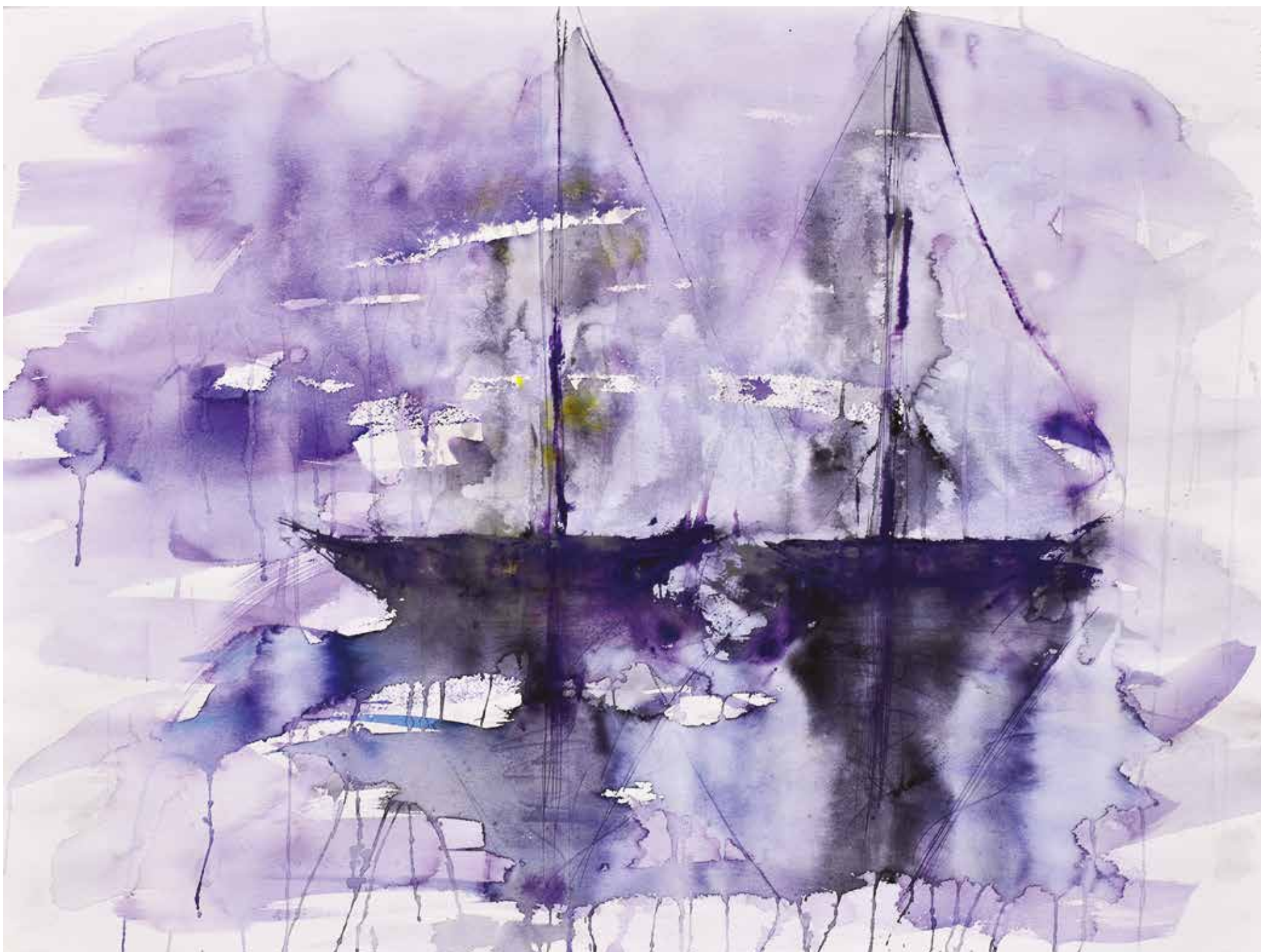
Barcas fantasma Acuarela y tintas. 61 x 80 cm