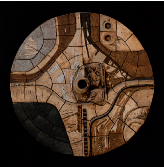
“Escultura” Arcadio Blasco