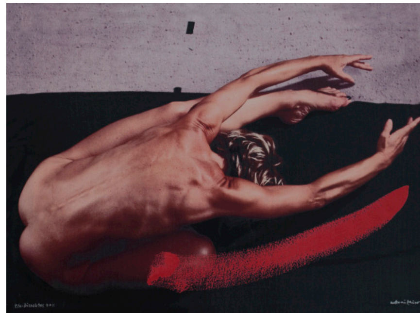
“Dissabtes 2011” Antoni Miró

Por último, destaca la obra de Antoni Miró quien durante su trayectoria artística funda el Grup Alcoiart i el Gruppo Denunzia en Brescia. Su obra está situada dentro del realismo social, lo que le conduce a un neofiguratismo que en los años 70 se identifica con el movimiento artístico “Crónica de la realidad”. La Universidad de Alicante tiene la “Cátedra Antoni Miró” de Arte Contemporáneo.